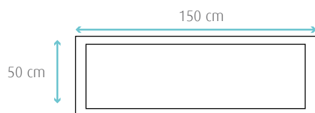
Vue en plan